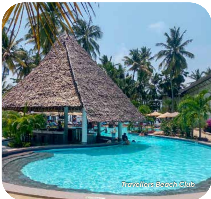
Travellers Beach Club

Efter en flyvetur lander vi igen i Danmark. En uforglemmelig rejse er forbi, men tankerne, kufferten og kameraet er forhåbentligt fyldt med gode minder.